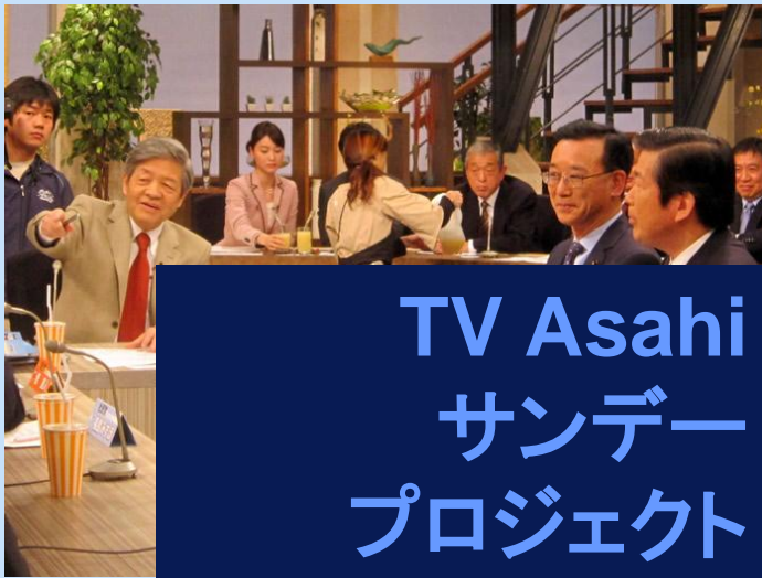
TV Asahi サンデー プロジェクト